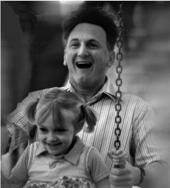
I filmen I am Sam spelar Sean Penn en pappa med utvecklingsstörning vars dotter ska omhändertas .