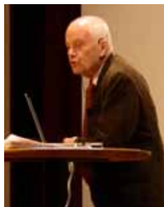
Bengt Göransson, f d utbildnings- och kulturminister, kritiserade kundbegreppet.